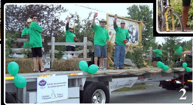
2 – Défilé à Edmundston