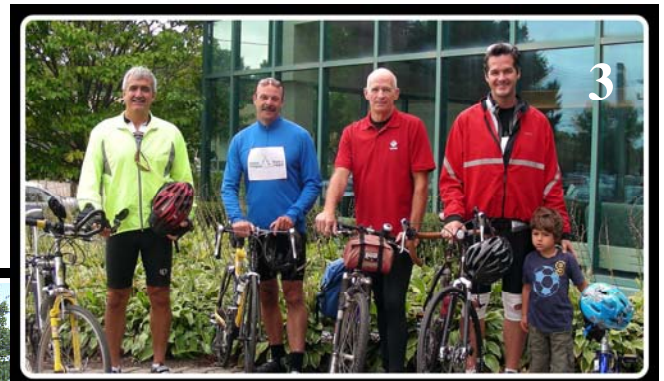
3 – Tournée provinciale en vélo

C'est grâce à des gens engagés comme vous que nous pouvons réussir à offrir des soins de qualité aux gens atteints du cancer. Continuez votre beau travail !