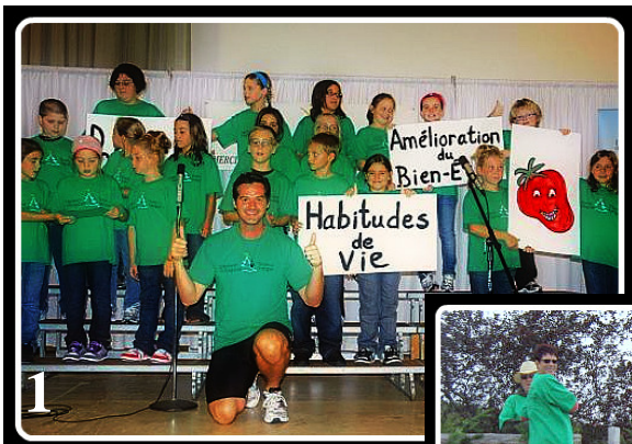
1 – Lancement de la campagne à Cap-Pelé