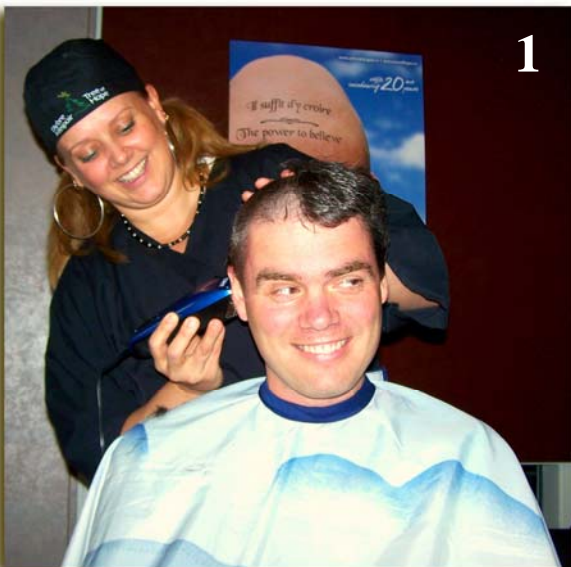
1 – Dans le cadre de la collecte de fonds de Primus à Edmundston, des employés se sont rasés la tête pour une bonne cause!

Quelques photos d'activités de la campagne de l'Arbre de l'espoir qui se sont déroulées dernièrement :