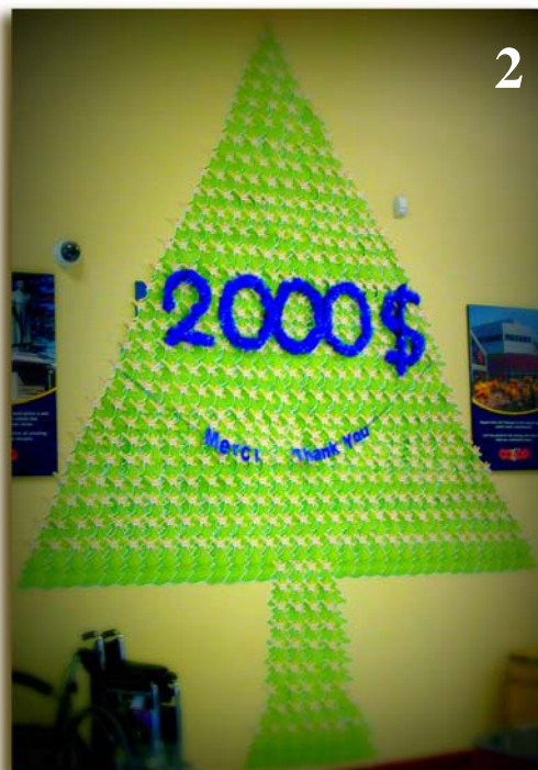
2 – La COOP de Dieppe a fait preuve d'imagination avec la vente de leurs petits arbres de l'espoir.

Objectif dépassé – podomètre de la santé « pas à pas »